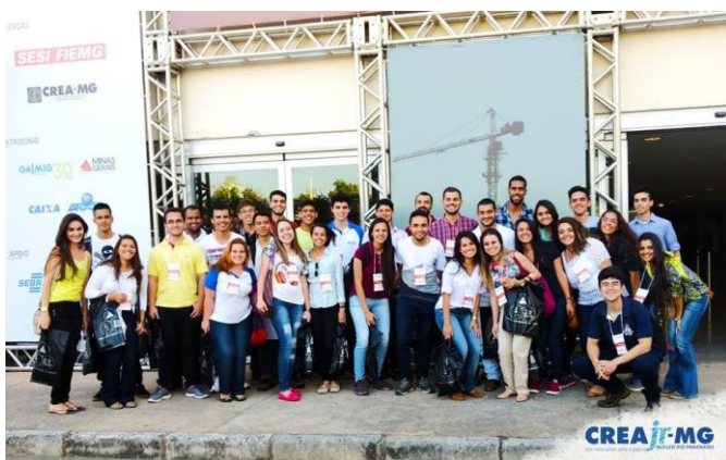
Figura 1: Estudantes na entrada da Feira Minascon