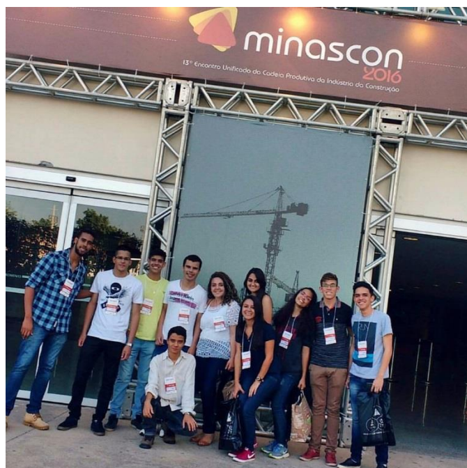
Figura 2: Estudantes na entrada da Feira Minascon