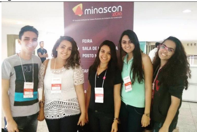
Figura 3: Estudantes na Feira Minascon