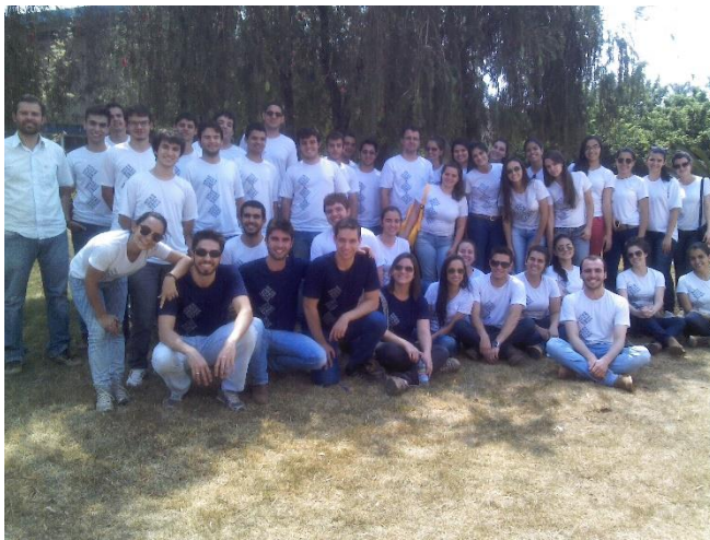
Figura 1: Alunos que participaram da visita

Descrição: Visita técnica Companhia Brasileira de Metalurgia e Mineração maior responsável pelo fornecimento de nióbio do mundo. Durante a visita os alunos ampliaram seus conhecimentos em metalurgia e mineração, além de terem visto as áreas industriais, a barragem e a mina de exploração da empresa.