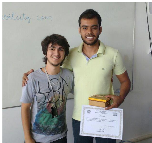
Figura 2: Ministrante recebendo certificado de participação